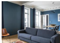
Vannes Snugr pour Smartflats