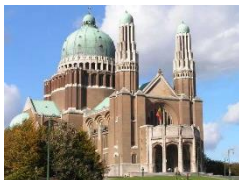
Cogénération à la Basilique