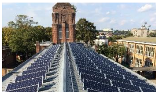
Photovoltaïque pour école à Jette