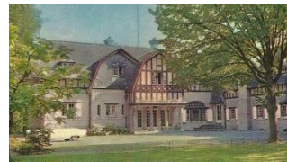
Rénovation globale Ecole Plein Air